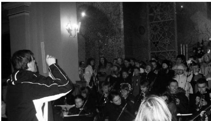
Koncert w krynickim kościele