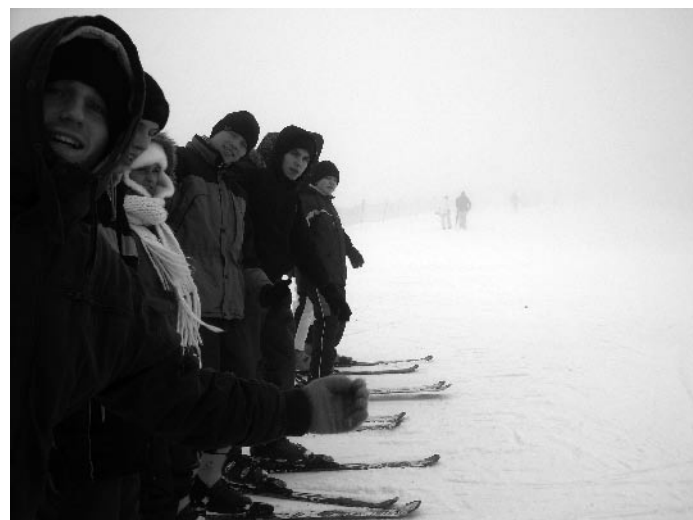
Narciarze z PSM na krynickich stokach