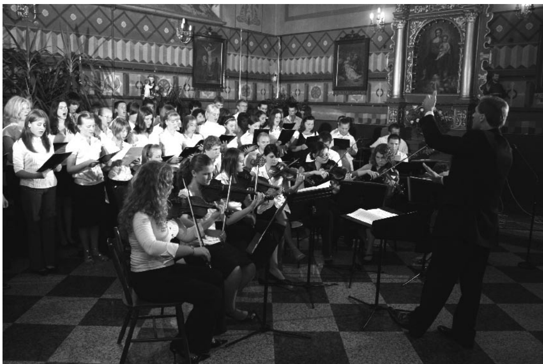
Koncert w Chorzelowie

Podsumowując, myślę że warto było podjąć trud i wziąć czynny udział w chorzelowskich uroczystościach. Obok nowego