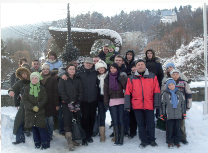
Zimowisko z ekologią