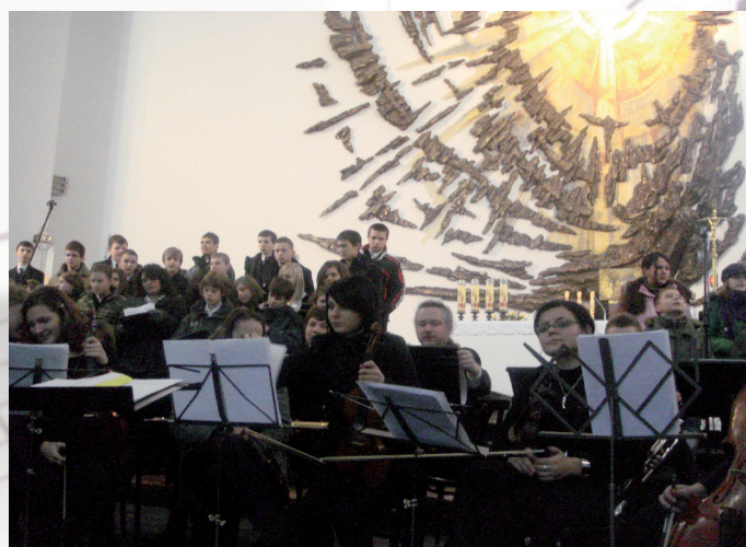
Koncert Chóru i Orkiestry w Kościele Ducha Św. na Borku

Państwowa Szkoła Muzyczna I i II stopnia, im. Mieczysława Karłowicza w Mielcu 39-300 Mielec, ul. Kościuszki 10, Tel/fax 017 586 29 76, E-mail: psm@powiat.mielcc.pl Strona internetowa szkoły: www.psmmielec.republika.pl