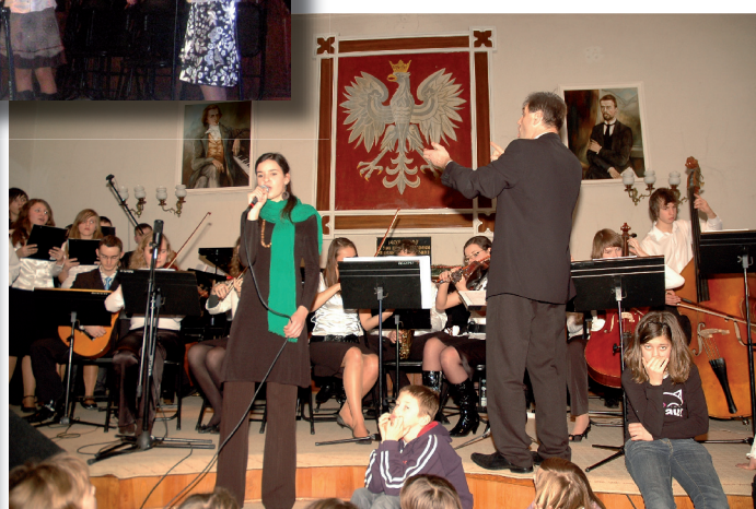
Orkiestra, Chór PSM